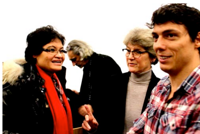
Taig Khris, record du monde de saut dans le vide et de saut en longueur en roller, lors de la réunion des donateurs Double Horizon.

Nous vous souhaitons d'excellentes fêtes de fin d'année.