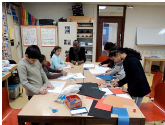
La sortie des enfants de l'école Davout à Beaubourg. En haut la visite et en bas l'atelier de restitution (dessin et collage).