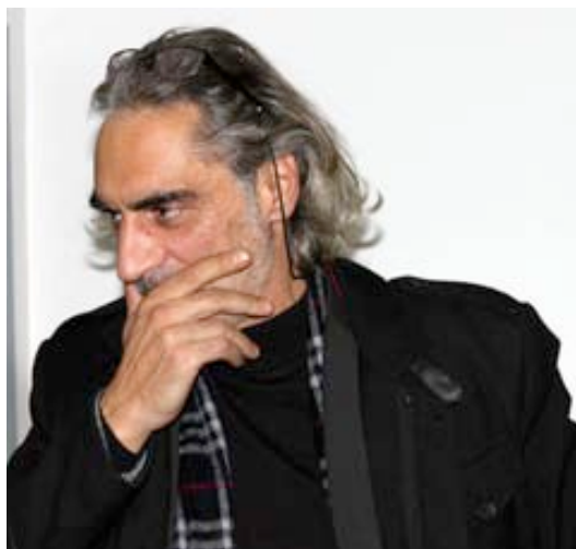
Le directeur de l'école Davout dans le 20 ème lors de la conférence sur les ZEP organisée par Double Horizon.

« Nous habitons Sabres dans les Landes. Les actions de Double Horizon sont connues dans notre village. Profitant d'un séjour à Paris, nous avons assisté à la réunion des donateurs du 29 novembre. L'intervention de Taïg Khris était prenante et bien ficelée : pris par son parcours, on a ensuite envie d'en tirer des leçons. Nous avons apprécié la présence de 80 personnes et la bonne organisation de la réunion. Aujourd'hui nous avons envie d'en savoir encore plus sur Double Horizon et sur ses actions. »